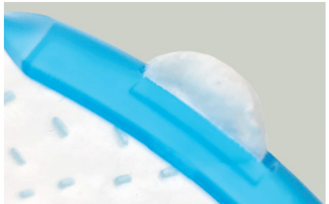
PASSAGGIO 2. Assicurarsi che le linguette del filtro siano posizionate nelle fessure della custodia per tenere il filtro in posizione.