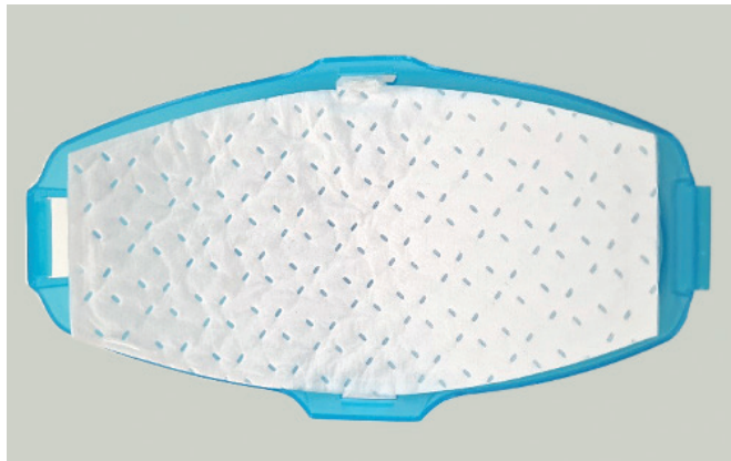
PASSAGGIO 1. Inserire un nuovo filtro nella custodia esterna blu.