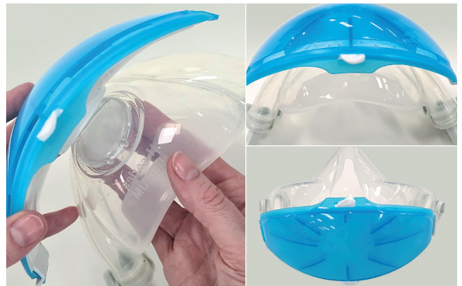
PASSAGGIO 4. Allineare la custodia assemblata con il filtro al cappuccio di espirazione della maschera in modo che le prese d'aria della custodia esterna si trovino nella parte inferiore della maschera. Fare clic sulla custodia sulla sede della valvola di espirazione. NOTA: il cappuccio della valvola di espirazione può rimanere in posizione.